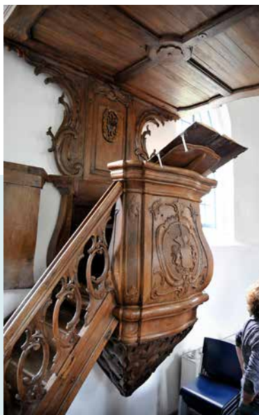
PREEKSTOEL, AFKOMSTIG UIT DE KERK VAN HEVESKES

INTERIEUR Veel van het interieur is bij de 'modernisering' in de jaren '50-'60 verdwenen en verkocht aan andere gemeenten. Zelfs de preekstoel uit de 17e eeuw verhuisde naar Baflo. Bij de restauratie kwamen wel een sacramentsnis en een piscina, een plaats waar de priester zijn handen kon wassen, naar voren. De nis maakte deel uit van het gotisch sacramentshuis dat oorspronkelijk uit de muur stak. De muren hebben een nieuwe stuc laag gekregen. De akoestiek is daardoor nog beter geworden.