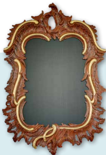
PSALMBORD, AFKOMSTIG UIT DE KERK VAN OTERDUM

Aan de wanden hangen drie liedborden afkomstig uit de kerk van Oterdum. Deze liedborden in rococo-stijl passen goed bij de eveneens in deze stijl uitgevoerde preekstoel. De kerk van Engelbert fungeert zo als bewaarplaats van goede herinneringen en kan hier mee ook het verhaal vertellen van Heveskes en Oterdum.